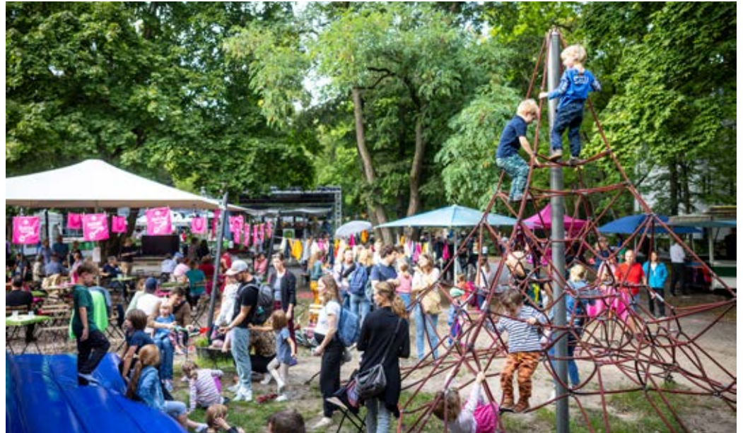
Den 10. Geburtstag hat Kultür Potsdam mit einem bunten Familienfest im Lindenpark gefeiert

Beim bunten Fest zum 10. Geburtstag von Kultür Potsdam im Lindenpark machten wir der Stadt Potsdam, Kulturrinteressierten und Veranstaltern von kostenfreien Veranstaltungen ein Geschenk: das Projekt "EintrittFrei Potsdam". Dahinter verbirgt sich die Webseite eintrittfreipotsdam.de . Hier werden Veranstaltungen gesammelt, die keinen Eintritt kosten. Diese werden übersichtlich in einem Kalender dargestellt. So ist es einfach, den Überblick über die Vielzahl der kostenfreien Kultur-, Sport- und Freizeitangebote in Potsdam zu behalten. Eine der ersten Veranstaltungen im neuen EintrittFrei-Kalender war das Festival "Kultur für JEDE*N!", das jährlich vom AWO Bezirksverband und dem AWO Büro Kinder(ar)mut organisiert wird. Auf der Internetseite können sich auch Veranstalter mit ihren Orten vorstellen; die Nutzer werden mit nur einem Klick zu den Events des jeweiligen Veranstalters weitergeleitet. Auf einer weiteren Unterseite haben wir Potsdamer:innen besondere Orte gesammelt. Damit wollen wir anregen, unsere Stadt mit den Augen der Bewohner zu entdecken. Die Möglichkeit zur Umsetzung verdanken wir einer Förderung der Postcode Lotterie.