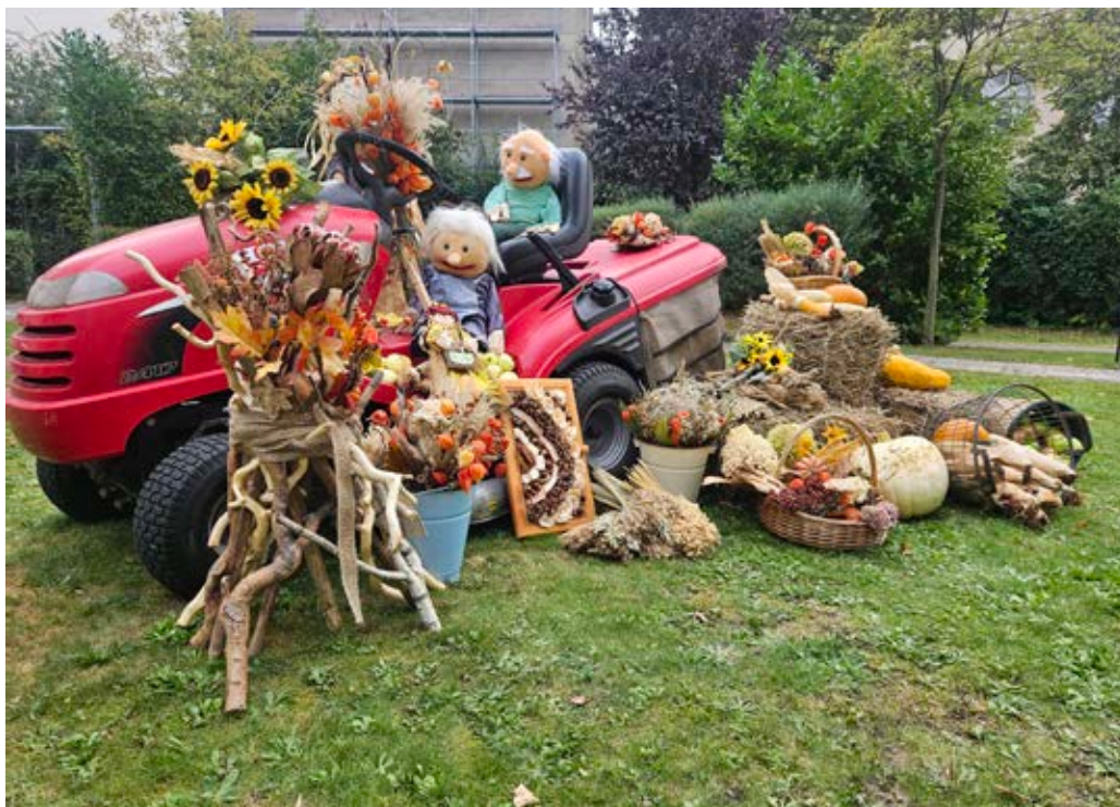
Ein echter Hingucker, der prachtvoll geschmückte Traktor