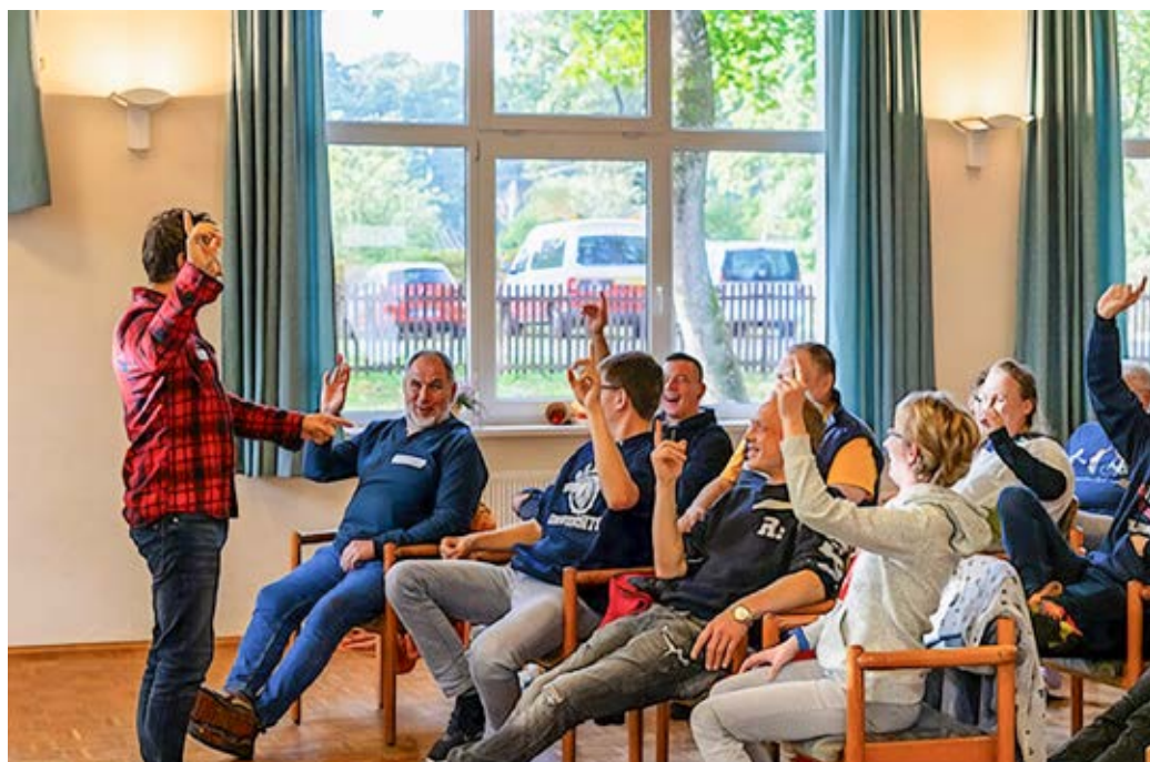
Die Teilnehmenden lernten, sich aktiv einzubringen, zu diskutieren, zu vergleichen, sich austauschen und ihre Standpunkte zu erklären.

nerschaftsrat an Vorstellungsgesprächen teil oder in anderen organisieren sich die Vertreter*innen eigenständig und fertigen ihre eigenen Protokolle an. Hier gibt es viel voneinander zu lernen und alle können von den Erfahrungen der anderen profitieren.