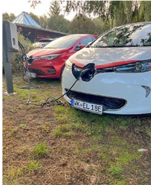
Bei der AWO Betreuungsdienste gGmbH ist die Umstellung des dortigen Fuhrparks auf E-Mobilität fast komplett

Andererseits wurden Maßnahmen zur Einsparung fossiler Energien (Erdgas) für sechs Standorte beantragt. Dadurch würde sich der Anteil erneuerbarer Energien bei der AWO Potsdam erhöhen und auch der Energieverbrauch absenken. Die Arbeit hat sich in jedem Fall schon jetzt gelohnt: Zum Zeitpunkt des Redaktionsschlusses lagen für die AWO Betreuungsdienste gGmbH Zuwendungsbescheide für die Beschaf-