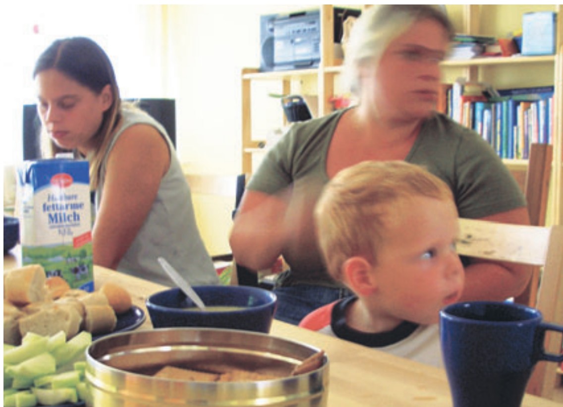
Gemeinsames Kochen im EKIZ

Das Eltern-Kind-Zentrum wird gefördert durch das MBJS und die Landeshauptstadt Potsdam