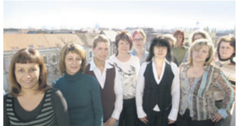
Die Mitarbeiterinnen der Geschäftsstelle der AWO Kinder- und Jugendhilfe gGmbH in Potsdam

Die Bildungs-, Erziehungs-, Betreuungs-, Versorgungs- und Unterstützungsange-