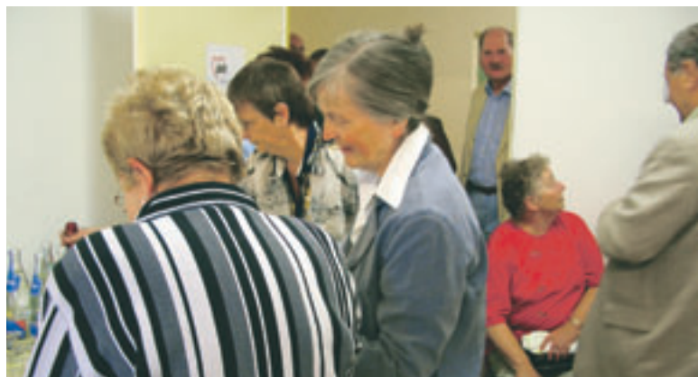
Eröffnung des Büroraumes im Seniorenzentrum „Wachtelwinkel“