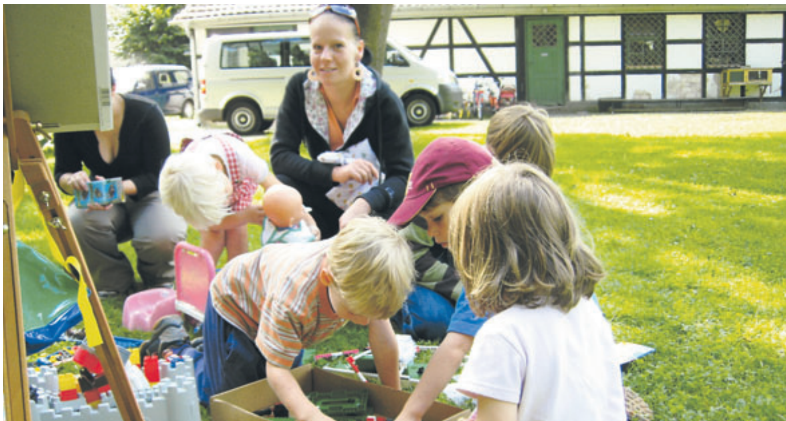
Spielerisches Engagement in Sacrow

POTSDAM ■ Anliegen unseres Ortsvereins ist es, neben der Arbeit im Verband auch nach außen wirksam zu werden. Dazu haben wir diverse Möglichkeiten diskutiert und uns dann auf die Unterstützung von Projekten im Kinder- und Jugendhilfereich verständigt, sowohl durch ehrenamtliche Mitarbeit, als auch durch Spenden.