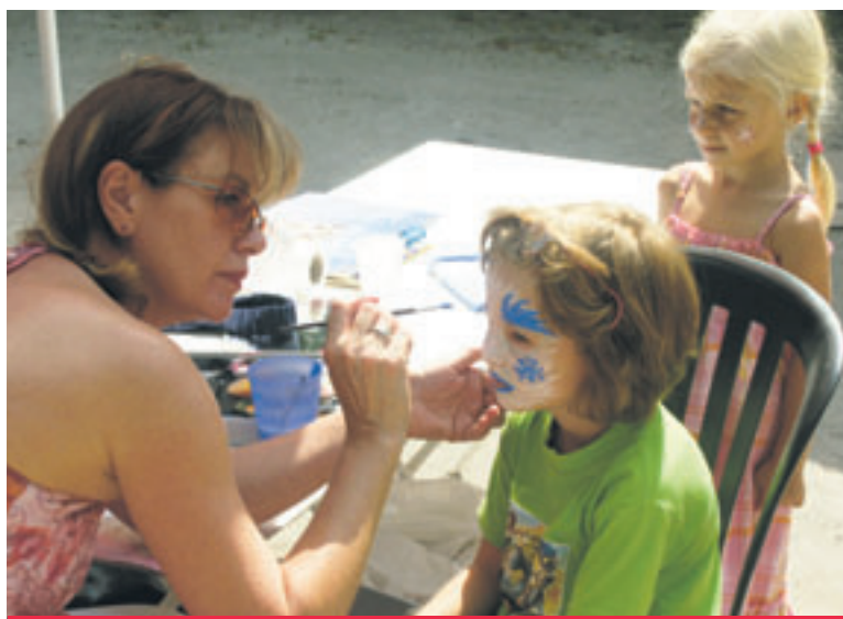
Kinderschminken im Bürgerhaus Bornim

Das Bürgerhaus Bornim wurde am 01. Juni 2000 eröffnet und ist ein generationsübergreifender Anlaufpunkt für alle Bürger, Vereine und Gemeinschaften. (Red.)