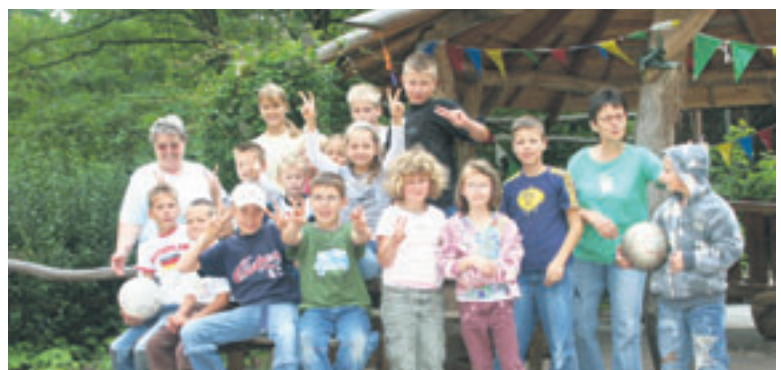
Hortkinder der Grundschule Brück