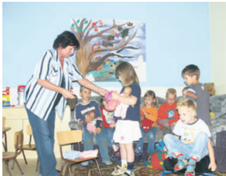
Kinder der Kita „Waldhaus“

Seit der Gründung des Ortsvereins besteht auch zur AWO der Partnerstadt Niederkassel eine Verbindung, die 2006 durch den Besuch einer Delegation der AWO Niederkassel zum Dachsbirgbergfest und zur Landesgartenschau in Rathenow wieder belebt und gefestigt wurde. Wir könnten noch