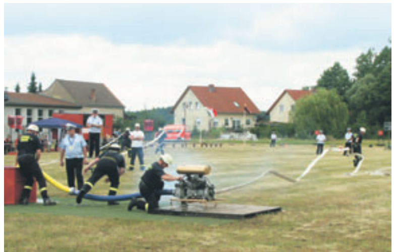
Wettkampf der Freiwilligen Feuerwehr