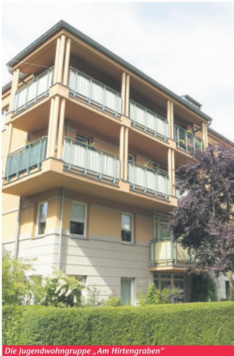
Die Jugendwohngruppe „Am Hirtengraben“