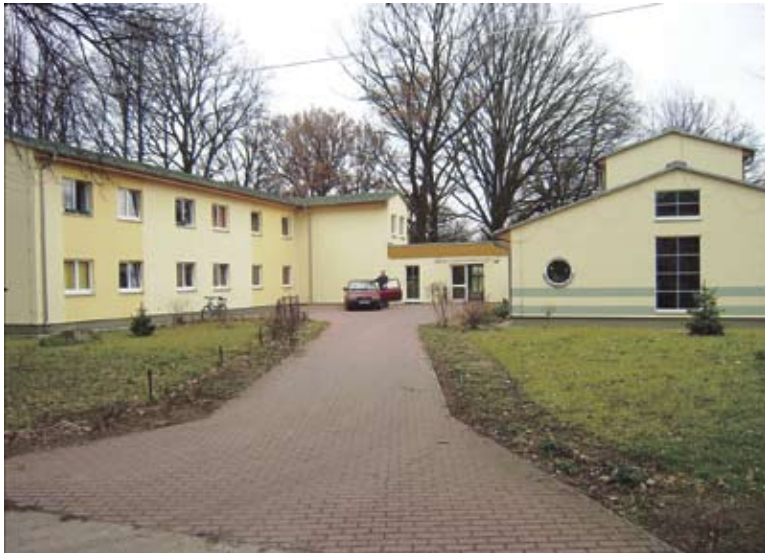
Obdachlosenheim der AWO Soziale Dienste gGmbH

POTSDAM ■ Eine der schlimmsten Auswirkungen von Armut ist der Verlust der eigenen Wohnung. Wer auf der Straße lebt, ist ohne Arbeit, ohne Schutz, ohne Freunde und häufig ohne Selbstbewusstsein.