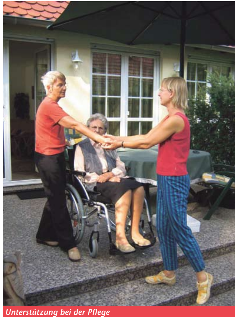
Unterstützung bei der Pflege

POTSDAM ■ Sie haben immer ein offenes Ohr, ermutigen, stärken, begleiten und unterstützen, wo immer dies nötig ist und widmen sich den Personen, die in der Vergangenheit häufig nicht ausreichend unterstützt worden sind - den pflegenden Angehörigen. 18 Pflegebegleiterinnen aus Kleinmachnow, Teltow und Stahnsdorf sind da, wenn von heute auf morgen Hilfe bei der Betreuung und Pflege von Angehörigen benötigt wird.