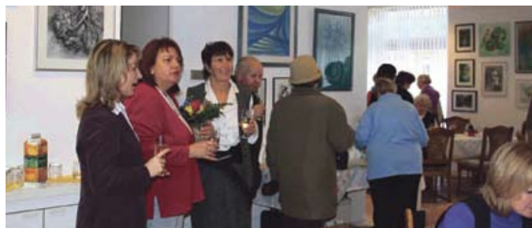
Eröffnung des AWO Treff Werder

treffen, Kurse besuchen, vielleicht gemeinsam Sport treiben, Feste gestalten oder einfach nur bei einem Gespräch entspannen können. Bislang fehlten dem 272 Mitglieder starken AWO Ortsverein Werder e.V. geeignete Räumlichkeiten für gemeinsame Veranstaltungen und Aktionen im Stadtteil. Daher haben der AWO Bezirksverband Potsdam e.V. und Mitglieder des AWO Ortsvereins Werder e.V. die Einrichtung in einer gemeinsamen Initiative gegründet. Kinder, Jugendliche, Familien, Vorruheständler und Senioren sind herzlich eingeladen, ihre Freizeit hier zu verbringen. Spielgruppen und Vereine