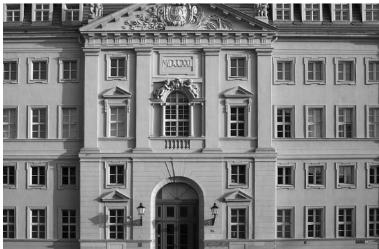
AWO Akademie Potsdam

In einer weiteren Fortbildungsveranstaltung geht es um das Thema „Wie gehe ich mit Menschen