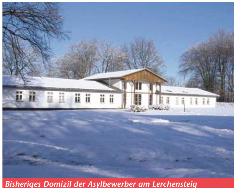
Bisheriges Domizil der Asylbewerber am Lerchensteig

Von dem neuen Standort verspricht sich die Stadt mehrere Vorteile und sieht diese vor allem in der verbesserten Verkehrsanbindung und in der Infrastruktur am Schlaatz mit Kindereinrichtungen,