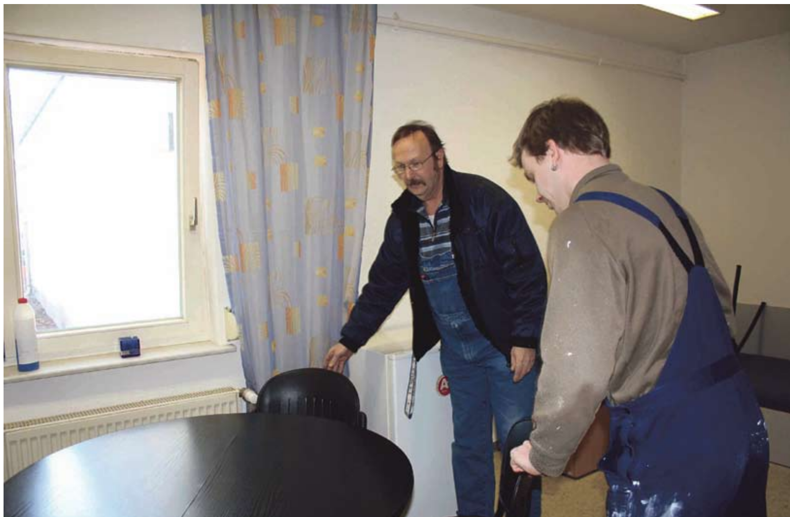
Arbeitsstunden werden abgeleistet

beitsfirma angestellt. Danach bin ich zur Bundeswehr gegangen. Dort hatte ich mich für vier Jahre verdingt. Leider konnte ich da nicht weiterbeschäftigt werden, wenig später kam dann Hartz IV und damit das tiefe Loch.