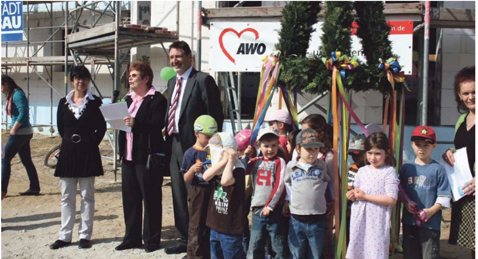
Richtfest in Eiche - neue Kita in der Kaiser-Friedrich-Straße