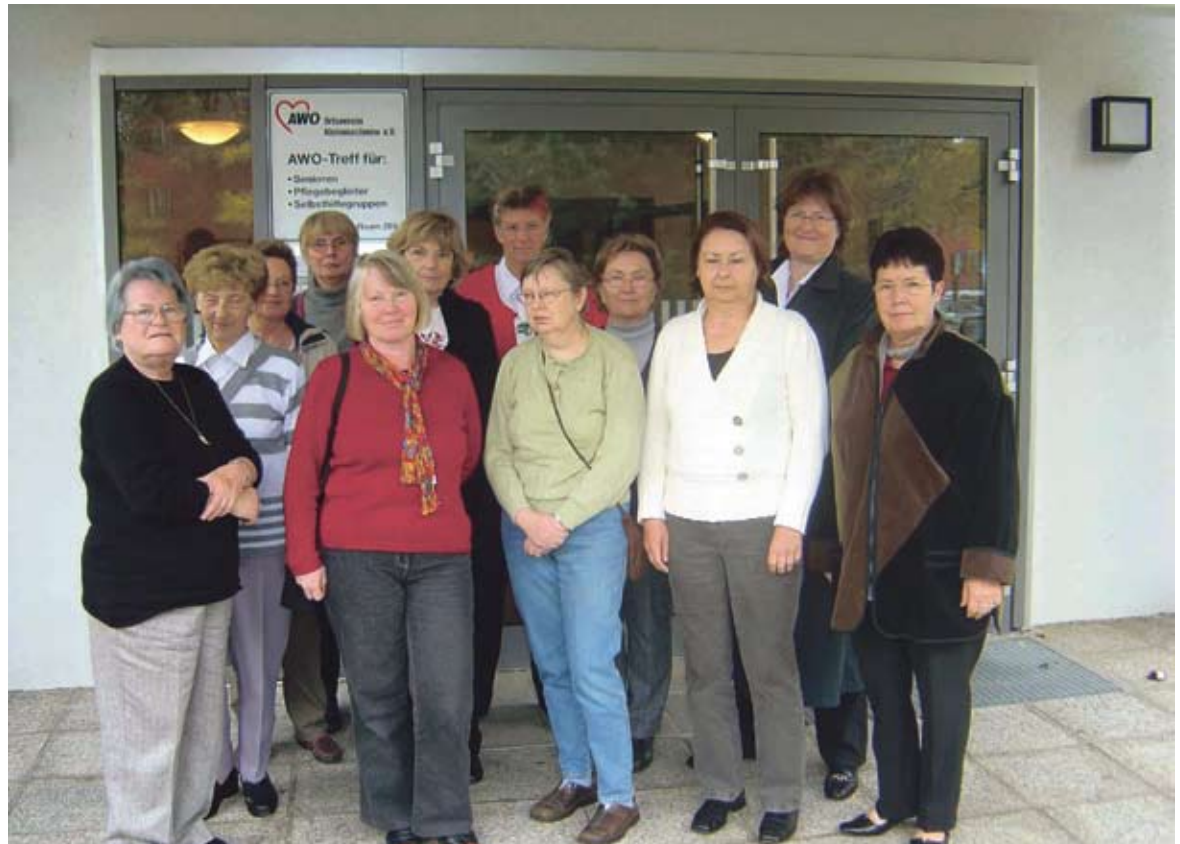
Das Team des Netzwerk Pflegebegleitung