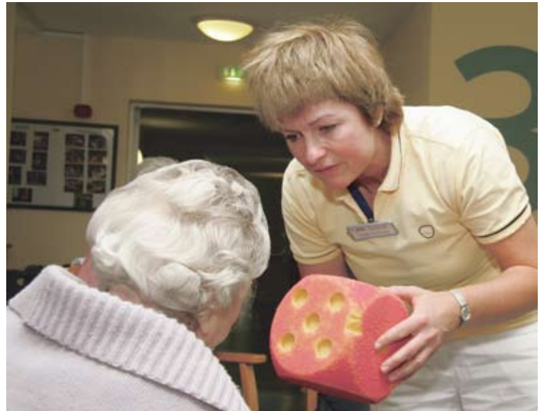
Intensive Beschäftigung mit den Bewohnern

Ich bin fünf Tage in der Woche hier, manchmal arbeite ich auch samstags. Seit Dezember 2008 sind wir zu dritt, jede Betreuungsassistentin auf einer Etage. So können wir das optimale für die Bewohner herausholen. Allerdings ist die Stelle erst einmal befristet bis Ende des Jahres. Wir hoffen jedoch alle, dass es danach weitergeht. Wir sehen ja die Erfolge, die Bewohner verhalten sich ganz anders, weil eine Bezugsperson für sie in der Nähe ist. Die Pflegekräfte haben einfach nicht die Zeit, sich so intensiv mit den Bewohnern zu beschäftigen. Ich würde, falls die Stelle am Ende des Jahres ausläuft, auch als ehrenamtliche Mitarbeiterin weiter tätig sein.