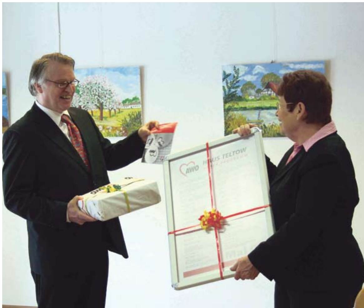
Geschenke zum Eröffnungstag

Mit zahlreichen Kooperationspartnern und ehrenamtlichen Helfern hält das AWO Haus Teltow auf über 200 Quadratmetern Nutzfläche ein umfangreiches Kultur-, Beratungs- und Hilfsangebot für Bürgerinnen und Bürger aus der Region vor, dass auf die unterschiedlichen Bedürfnisse der Generationen und auf den Bedarf vor Ort abgestimmt ist.