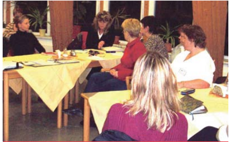
Personeller Wechsel im OV Waldstadt e.V.

Darüber hinaus haben Mitglieder die Gründung eines Arbeitskreises „Öffentlichkeitsarbeit“ angeregt, um die Arbeit, die Interessen und die Ziele der Ortsvereine des AWO Bezirksverband Potsdam e.V. nach außen noch besser bekannt zu machen, dafür gemeinsame Aktivitäten und Projekte zu kreieren