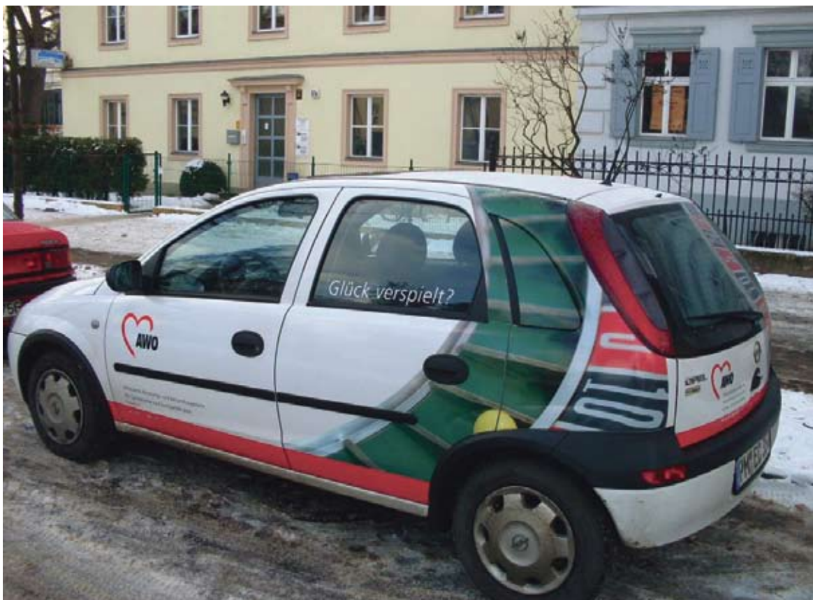
AWO Suchtberatungsstelle in der Berliner Straße in Potsdam

und Suchtgefährdete der Arbeiterwohlfahrt in Potsdam haben im vergangenen Jahr doppelt so viele Menschen Hilfe wegen Spielsucht in Anspruch genommen als noch im Jahr 2007. Als eine der Schwerpunktberatungsstellen für Glücksspieler im Land Brandenburg bietet